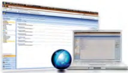
Tracciabilità di appuntamenti, impegni...