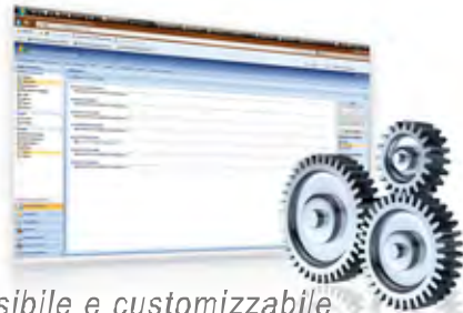
Sistema flessibile e customizzabile