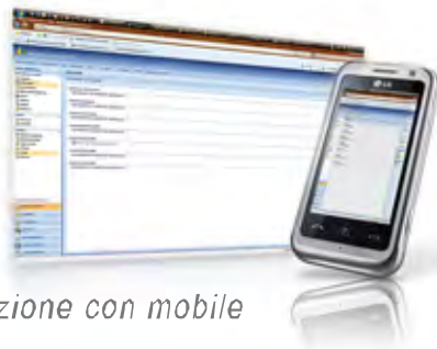
Integrazione con mobile