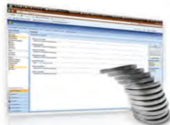
Valutazione del ritorno economico