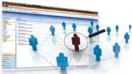
Campagne marketing multicanale