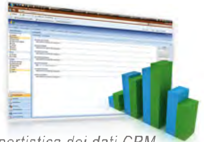
Reportistica dei dati CRM